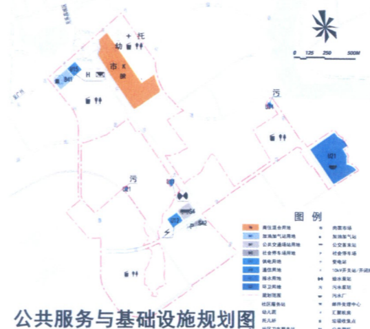
公共服务与基础设施规划图