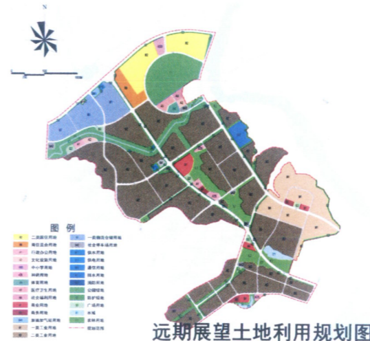
远期展望土地利用规划图